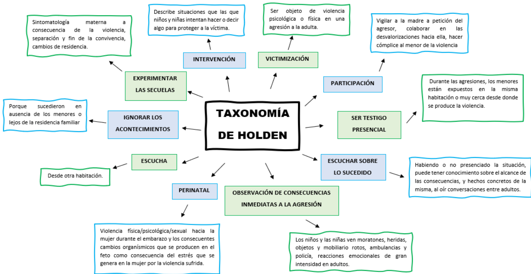
Tabla 4 Taxonomía de Holden.